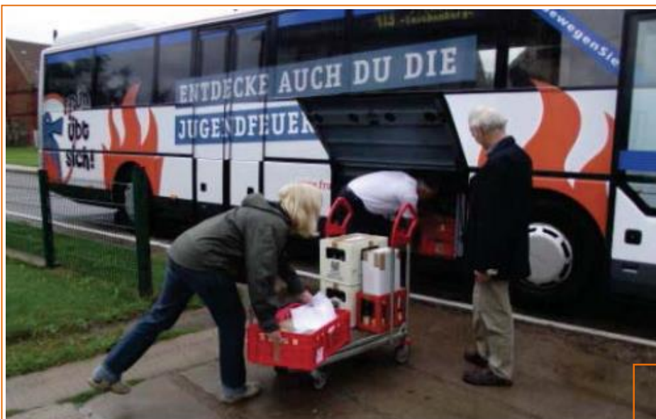
Autobus utilizzato per il trasporto combinato