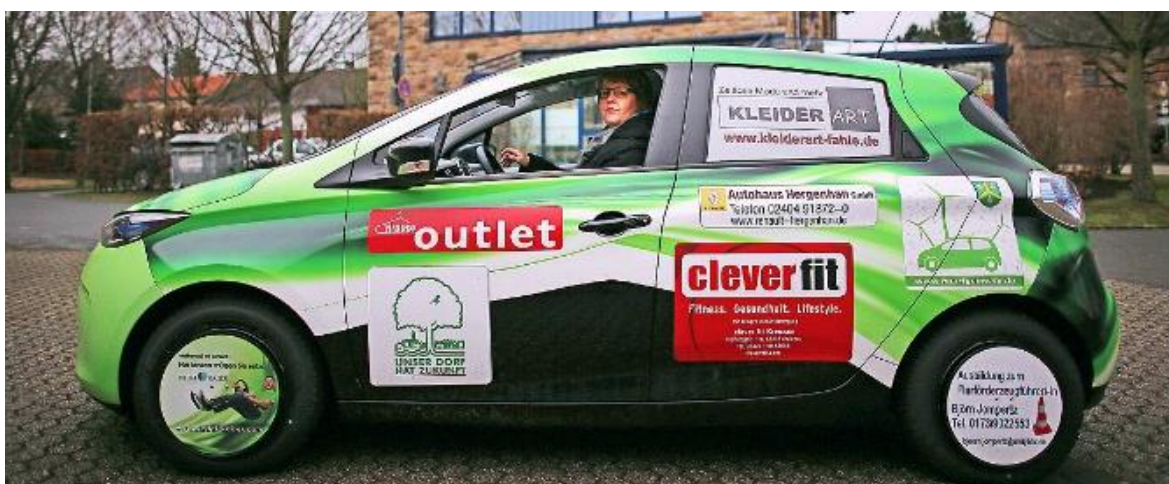
Immagine Auto di Paese

L'obiettivo dell'iniziativa è quello di rispondere alle necessità di spostamento degli abitanti di un paese di 1900 residenti, andando a colmare in parte le lacune del servizio pubblico esistente.